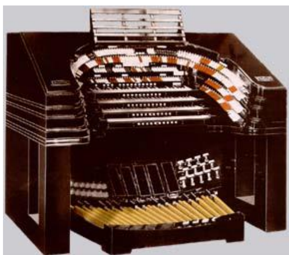
Wurlitzer orgel, Radio City Hall, New York.

Dezen mensch zat op den praatstoel en vervolgde zijn verhaal en vertelde dat hij in de zestiger jaren van den vorigen eeuw in New York “The Radio City Hall” bezocht en onder de indruk was van het concert op het machtige Wurlitzer orgel.