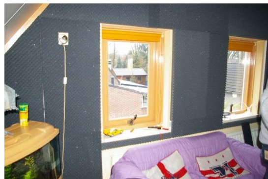
De luisterpositie tegenover de set.

Maar, .....zo staat het echter niet opgesteld. Hier wordt geluisterd in de breedte met de luidsprekers aan weerszijden van het meubel, echter heel ver uit elkaar. Volgens Dub moet dit nu juist een heel breed geluidsbeeld opleveren. Tevens staan de speakers pal tegen de achterwand en stevig ingedraaid.