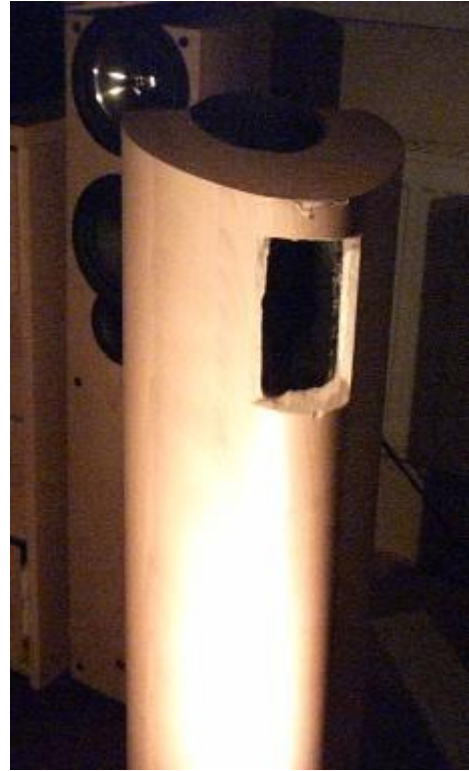
De modificatie op de achterzijde.