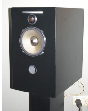
Het eindresultaat van het zelfbouwproject op basis van de Pioneer TS-C171PRS autoluidsprekers.