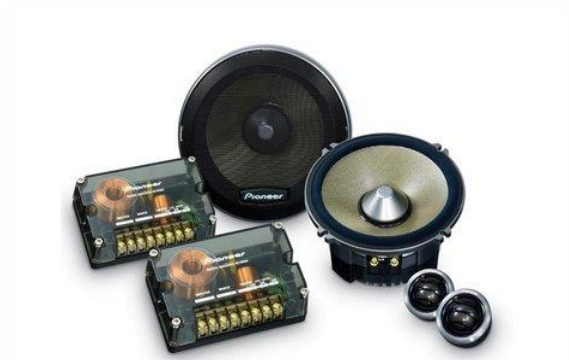
De basis voor het zelfbouwproject van The Dub Oracle.