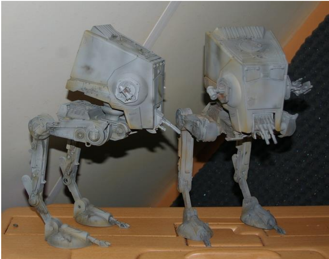
Een creatie van The Dub Oracle

Op mijn opmerking dat ik denk dat het wel heel druk is in het hoofd van de hoofdpersoon, krijg de reactie dat ik wel lijk op een psychiater. Dat herhaalt zich nog een paar maal gedurende ons samenzijn, maar dat legde geen smet op ons treffen. The Dub Oracle praat gemakkelijk, maar het blijkt moeilijk te zijn al die woorden te vatten. Hobbymatig is The Dub Oracle ook met muziek bezig, maar loopt daar niet mee te koop. Later horen we een aantal stukken, welke een bijzondere betekenis voor 'm hebben. Samenvattend kun je stellen dat de hoofdpersoon de weg bewandelt in de trant van "Onderzoekt alle dingen en behoudt het goede". Dat laatste dan uiteraard wel op zijn eigen, ultieme, subjectieve wijze. Een passend voorbeeld is wel zijn technische zienswijze, die volgens 't boekje niet waarheidsgetrouw is. Tevens schuwt hij niet een rigoureuze zienswijze in de praktijk toe te passen. Zijn voormalige Kef-luidsprekers klonken niet goed omdat het midden-hoog in een gesloten kast zat. De oplossing is dan dat het opengemaakt wordt en alles wat je daarbij nodig hebt is een zaag. Ondanks deze ingrijpende aanpak zijn de speakers verbannen naar een berging. Het resultaat gaf geen bevrediging. The Dub Oracle besluit aan een zelfbouwproject te beginnen, dat uiteindelijk hedenmiddag haar kunsten mag vertonen.