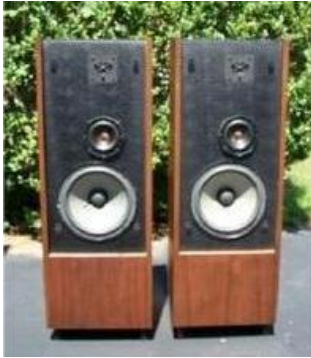
Infinity Column II.

de relatief jongere luidsprekerfabrikant Adam Audio. Zijn er overeenkomsten? Daarover later meer. Verschillen? Zeker.