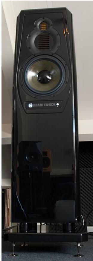
Voorzijde Adam Audio Tensor Gamma.