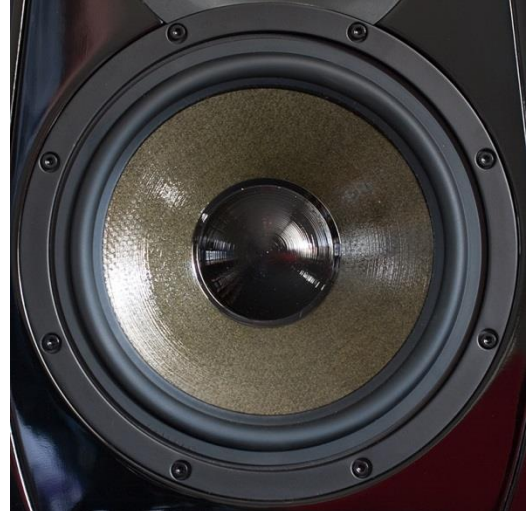
Adam Audio Tensor Gamma: 9" woofer frontzijde.