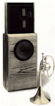
Infinity Reference Standard 2.5.