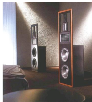
Infinity Reference Standard Gamma/Delta.