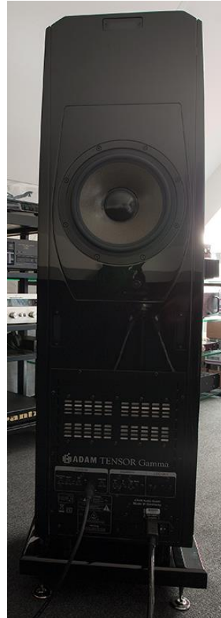
Achterzijde Adam Audio Tensor Gamma.