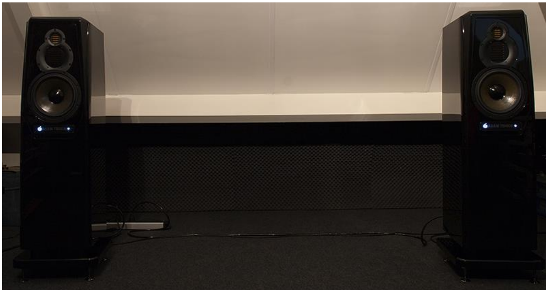
Adam Audio Tensor Gamma.

Het gaat bij deze luidspreker allemaal heel onopvallend en met een gemak wat je van een grote luidspreker mag verwachten. Dat gemak wordt echter nog completer als je bedenkt dat je met een aanschaf van deze luidsprekers en een bron helemaal klaar bent om te genieten van je favoriete muziek. En of dat nu jazz, blues, klassiek of Hollandse meezingers zijn, de Adam laat horen wat het bronmateriaal in zich heeft. Ik heb met name laag gehoord, als de opname het had, waar je u tegen zegt. De muziek van Oscar Peterson bracht me in vervoering en gaf flashbacks naar tijden van de vorige eeuw. Yello klinkt zoals altijd spectaculair en met een afbeelding die het verdient. Een orkest wordt in zijn volheid weergegeven, zonder dat het systeem tegen zijn grenzen aanloopt. Kortom: De luisteraar wordt op hoog niveau audiofiel bediend, zoals je dat als gast mag verwachten in een vijf sterren de luxe hotel op een of ander exotisch eiland. Finetunen doe je met een klein schroevendraaiertje om zo het klankmatig eindresultaat te vervolmaken.