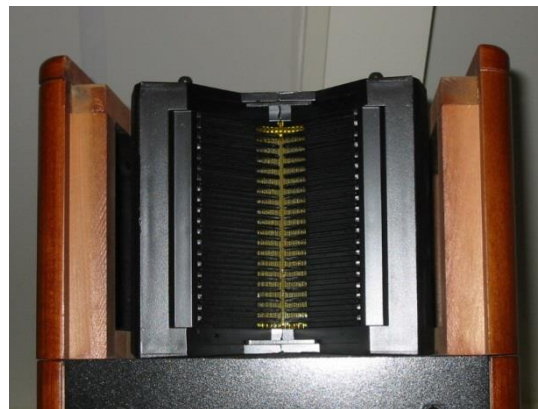
De Heil Motion Transformer van de ESS AMT 321 S.