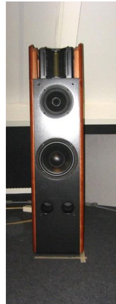
De ESS AMT 321 S zonder front en kap.