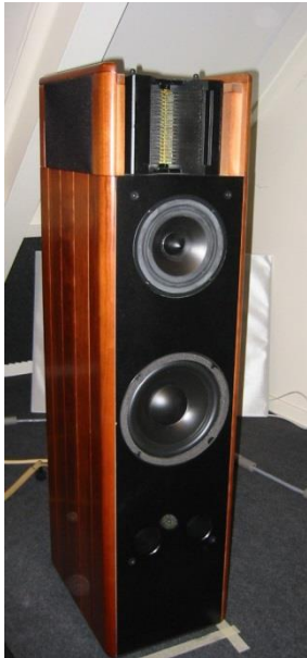
De ESS 321 S zonder front en kap. De houtaccenten met verticale groeven geven de luidsprekers extra uitstraling.

ESS is van Amerikaanse komaf en de opbouw van de luidsprekers is in de afgelopen dertig jaar nauwelijks gewijzigd. ESS maakt sinds 1973 gebruik van de Heil Motion Transformer en bezit de exclusieve rechten om gebruik te maken van deze technologie in haar luidsprekers. Het merk voerde vroeger een marginaal vrouwvriendelijk beleid, hetgeen bleek uit de afmetingen en uiterlijke verschijningsvormen van sommige speakers uit de AMT lijn. Tegenwoordig zien de "zuilen" er rank uit en met name de houtaccenten aan de zijkanten doen sterk denken aan Sonus Faber en Opera.