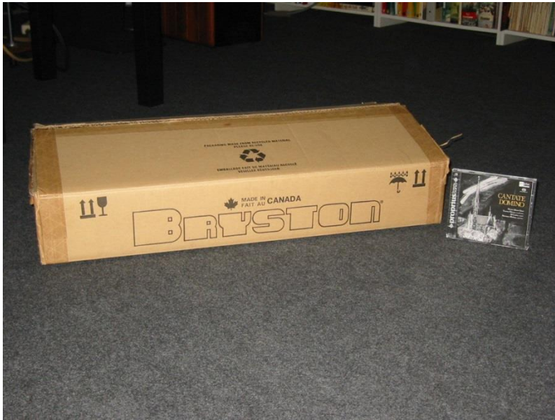
Verpakking Bryston B60 SST.

Na het uitpakken van de doos, die op zichzelf qua afmeting geen bijzondere indruk op me maakte, kwam er een apparaat tevoorschijn dat slechts “een streepje” hoog is. Bij het in de hand nemen van het apparaat valt me direct op dat het voedingsgedeelte zich aan de rechter zijde moet bevinden gezien de zwaarte van het apparaat aan die kant.