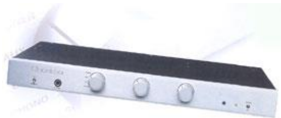
Voorzijde Bryston B60 SST.