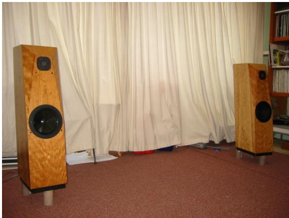
De Avalon Arcus