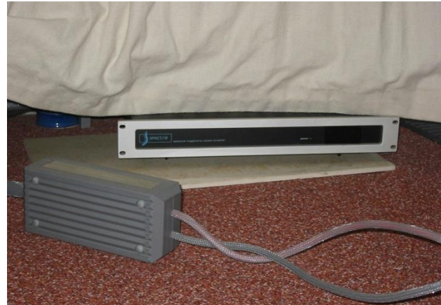
Spectral DMA 80