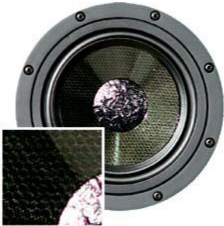
Woofer A.D.A.M. Audio A.R.T. Compact Monitor