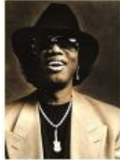
Johnny Guitar Watson